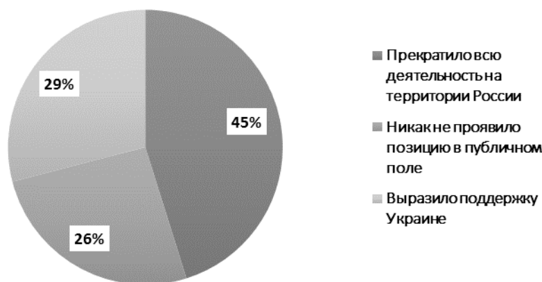
Диаграмма 1. Реакция международных издательств в публичном пространстве

Чуть меньше трети издательств высказали свое сочувствие и осуждение, однако никак не прокомментировали влияние ситуации на их операционную деятельность, при этом одно издательство акцентировало внимание на том, что статьи от российских ученых по-прежнему будут приниматься к рассмотрению в общем порядке.