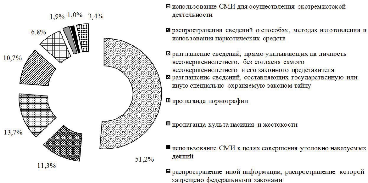
Рис. 1. Распределение предупреждений, выданных редакциям СМИ Роскомнадзором в 2007-2011 годах