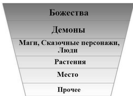
Рис. 1. Иерархия сверхъестественных существ

положение по сравнению с божествами. Они могут быть как хорошими, так и плохими (демоны, существа, духи).