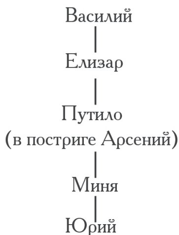
Рис. 2. Генеалогия рода Сухановых