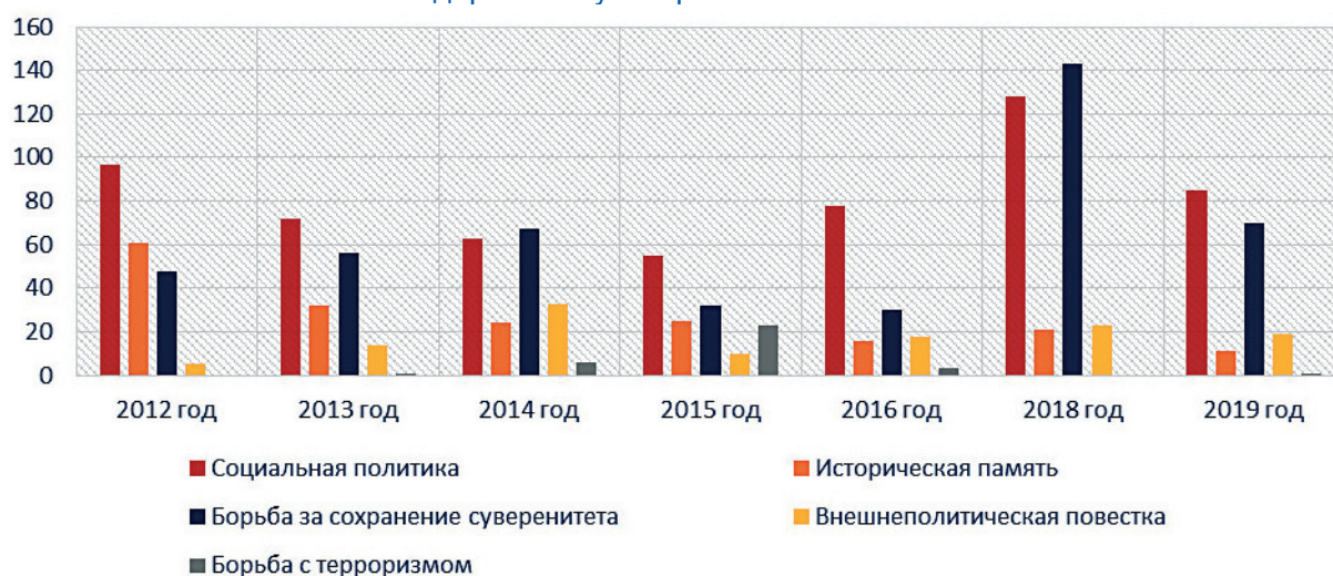
Рис. 1. Темы Посланий Президента РФ Федеральному Собранию РФ 2012–2019 гг. – итоги контент-анализа