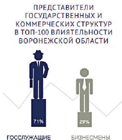
Рис. 3. Соотношение влияния государственных и коммерческих структур в Воронежской области

собственной деятельности и его коммуникации с органами власти.