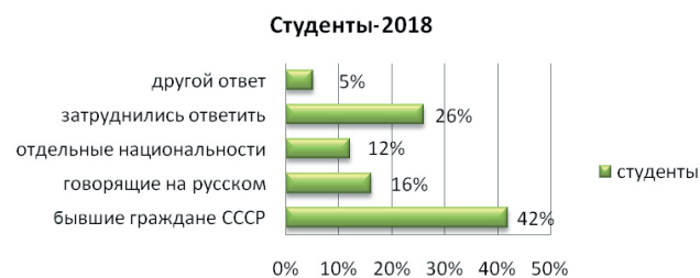
Рис. 3. Восприятие соотечественников

В Воронежской области с 2009 г. действует Государственная программа по оказанию содействия добровольному переселению в Россию соотечественников, которые живут за рубежом. По данным региональной власти за 2017 г. в область обратилось более 7 тысяч человек с заявлениями. «Общий итог работы по переселению в наш регион – 57 тысяч человек. Уровень соотечественников трудоспособного возраста в общем количестве прибывших в течение последних лет не опускается ниже 97 %, что способствует компенсации естественной убыли трудоспособного населения» [11]. Привлечение в регион мигрантов нужно коррелировать с позицией местных жителей. В этой связи представляется интересным, кого рассматривают в качестве соотечественников студенты (рис. 3).