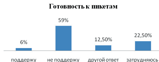
Рис. 2. Процентное соотношение ответов на вопрос: «Поддержите ли Вы пикеты, акции против иностранных трудовых мигрантов?»

причин митинга и от его статуса (разрешенный или неразрешенный). Такая позиция студентов не может не вызывать беспокойство. Те, кто не определился с позицией, вполне могут стать объектом протестной мобилизации, если сложится ситуация, затрагивающая их интересы. На выбор неопределившихся могут повлиять внешние факторы, в том числе возможные манипуляции со стороны политических игроков.