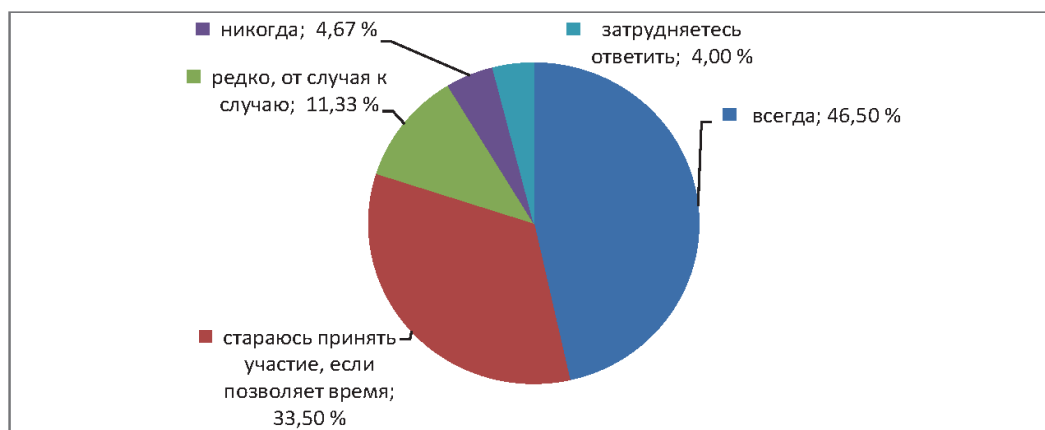
Рис. 2. Электоральная активность граждан

ются принимать участие, если позволяет время», а 11,33 % респондентов принимают участие «редко, от случая к случаю» (рис. 2).