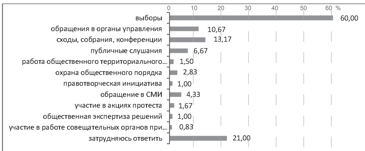
Рис. 1. Формы общественного участия граждан в принятии решений за последний год

При достаточном уровне осведомленности граждан о формах участия в принятии решений респонденты продемонстрировали невысокий уровень гражданской активности, в данных формах участия в решении проблем муниципалитета. На вопрос: «В каких формах гражданского участия Вы принимали участие за последний год?» респонденты ответили следующее: выборы (60 %); сходы, собрания, конференции (13,17 %); обращения в органы управления (10,67 %). Непопулярными формами участия в принятии решений являются обращение в СМИ (4,33 %); работа общественного территориального управления (1,5 %); охрана общественного порядка (2,83 %); публичные слушания (6,67 %); правотворческая инициатива (1 %); участие в работе совещательных органов при органах управления (0,83 %) (рис. 1).