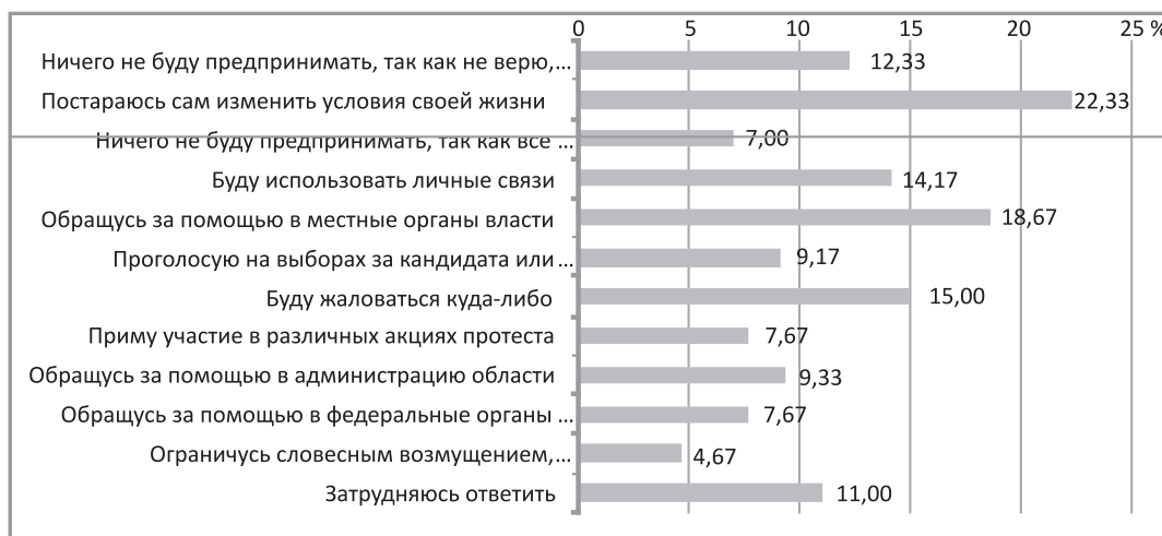
Рис. 5. Готовность граждан к активному влиянию на органы местного самоуправления в случае необходимости решения актуальных для них проблем

администрацию области»; 7,67 % «обратятся за помощью в федеральные органы власти»; 7,67 % «примут участие в различных акциях протеста» (рис. 5).