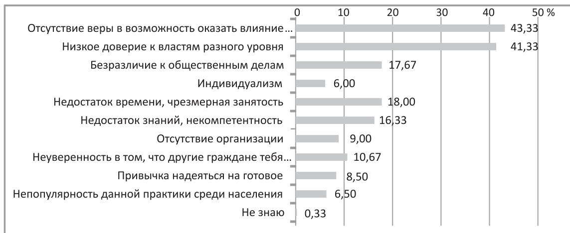
Рис. 6. Причины, препятствующие активному общественному участию граждан в принятии решений

другие граждане поддержат (10,67 %). «Антистимулами» участия в решении вопросов местной жизни являются, по мнению респондентов, и эгоистические причины, такие как «индивидуализм» (6 %), привычка надеяться на все готовое (8,5 %). Некоторые ельчане указывают и такие причины, как непопулярность этой деятельности среди населения (6,5 %) (рис. 6).