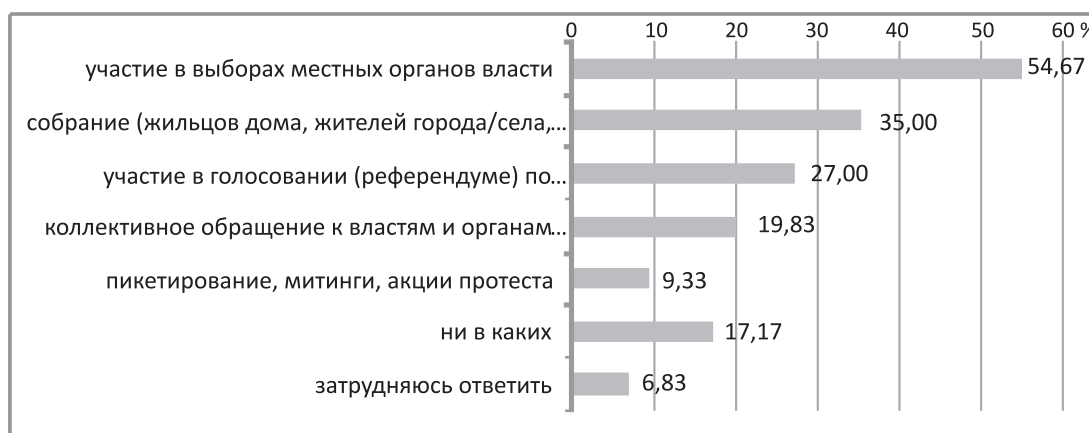
Рис. 4. Готовность граждан в принятии общественного участия для решения местных проблем

ется изучение степени готовности граждан принимать участие в решении местных проблем. 54,67 % выразили готовность принять участие в выборах местных органов власти; 35 % готовы участвовать в разных формах собраний (жильцов дома, жителей города/села, жителей района); 27 % готовы принять участие в голосовании (референдуме) по вопросам местного значения; 19,83 % – в коллективных обращениях к властям и органам местного самоуправления; 9,33 % – в пикетировании, митингах, акциях протеста (рис. 4).