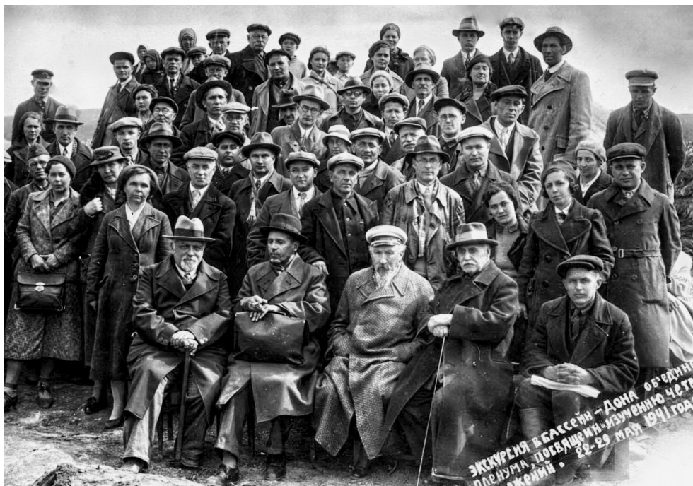
Участники Воронежского геологического пленума Советской секции INQUA (май 1941 г.)

сам организации пленума, обнаруженного одним из авторов в фондах Рукописного архива ИИМК РАН [8, л. 55]. Из документа явствует, что совместные работы археологов и геологов на памятниках Костенковско-Борщевского палеолитического района в течение нескольких предшествовавших лет дали интересные результаты, послужившие поводом для созыва форума. В документе перечислены те представители воронежской геологии и археологии, на активное участие которых в подготовке пленума возлагали надежды столичные деятели.