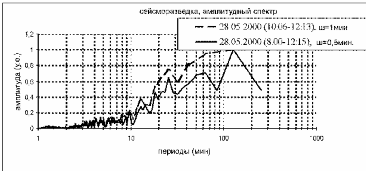
Рис. 1. Спектры сейсмических колебаний при разном шаге сглаживания

циалом притяжения в какой-то мере нарушается. Амплитуда измеренных вариаций градиента в несколько раз больше теоретических значений. Причины этого пока неясны и авторы статьи отмечают это лишь как установленный факт. Чтобы доказать связь между вариациями градиента и собственными колебаниями, достаточно было провести измерение неприливных вариаций градиента в различных двух или более пунктах Земли, удаленных на значительные расстояния друг от друга. И если вариации между собой совпадают, то вопрос решается однозначно. Дело в том, что гравиметрами, в отличие от сейсмографов, фиксируются только сфероидальные колебания, которые возникают вследствие деформации Земли за счет сдвига масс в ее недрах в результате сжатия и расширения. Собственные колебания Земли вызываются землетрясениями и существует бесконечное число форм собственных колебаний. Так, по крайней мере, считают некоторые исследователи [10-13], хотя этот вопрос является дискуссионным. Те не менее собственные колебания Земли, предсказанные ранее научными исследованиями по теории упругости, впервые были подтверждены после Камчатского и Чилийского землетрясений.