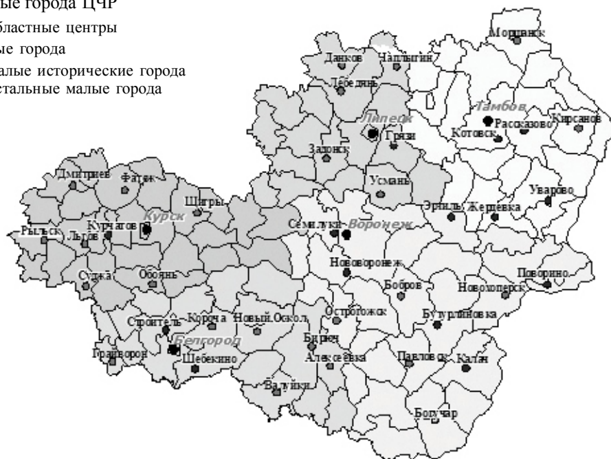
Рис. 1. Малые исторические города Центрально-Черноземного экономического района* (составлено автором)

номике. За рубежом исследованиями по развитию туризма в исторических городах занимались М. Shakley (1998), J. Van der Borg и А.Р. Russo (1999), В. J. Graham (2000) [12].