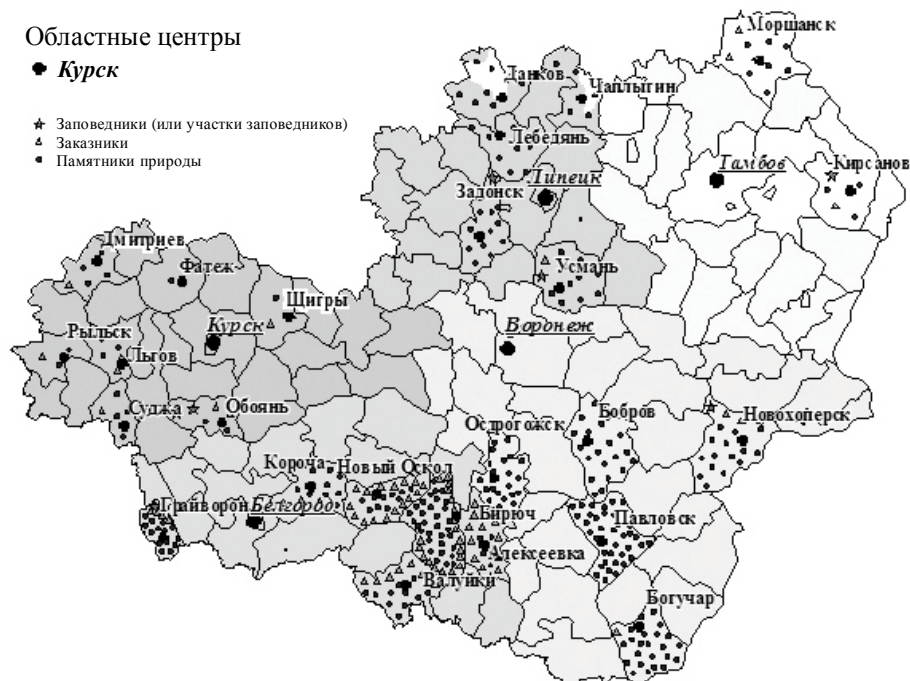
Рис. 2. Объекты ООПТ в муниципальных районах малых исторических городов ЦЧР* (составлено автором)