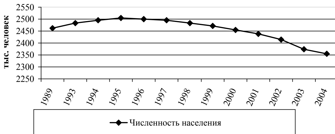
Рис. 2. Динамика численности населения Воронежской области в 1989-2004 гг. Составлено по [6, 7, 9].