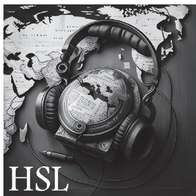
Рис. 4. Обложка подкаста «HSL...»