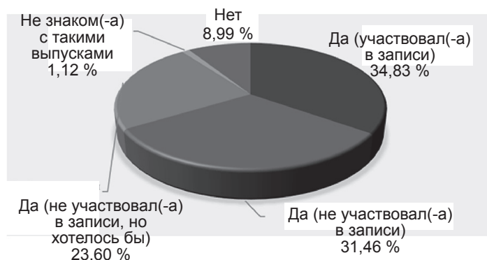
Рис. 3. Результаты ответа на вопрос: «Понравились ли Вам выпуски, в записи которых участвовали обучающиеся?»

ствия со всеми слушателями подкаста (вне зависимости от их принадлежности к той или иной образовательной организации), которое может выражаться в их привлечении к: подготовке вопросов, требующих особого внимания и дополнительного пояснения в рамках заданных тем; корректировке общей структуры двух будущих сезонов; выбору тематики спецвыпусков; поиску интересующих аудиторию спикеров для бонусных эпизодов.