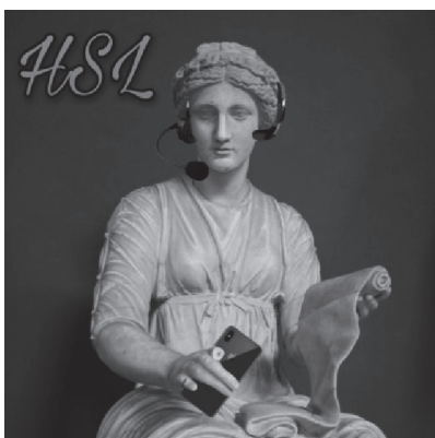
Рис. 5. Обложка 1-го сезона подкаста «HSL...»