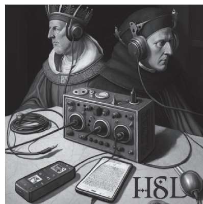
Рис. 6. Обложка 2-го сезона подкаста «HSL...»

тельно, что значительная часть визуального контента создана самими подписчиками. Это указывает на востребованность данной составляющей сопровождения подкаста, повышении заинтересованности в его содержании (и в образовательном процессе). Настоящий тезис подтверждают и результаты проведенного опроса.