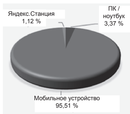
Рис. 2. Результаты ответа на вопрос: «На каком устройстве Вы обычно слушали подкаст?»