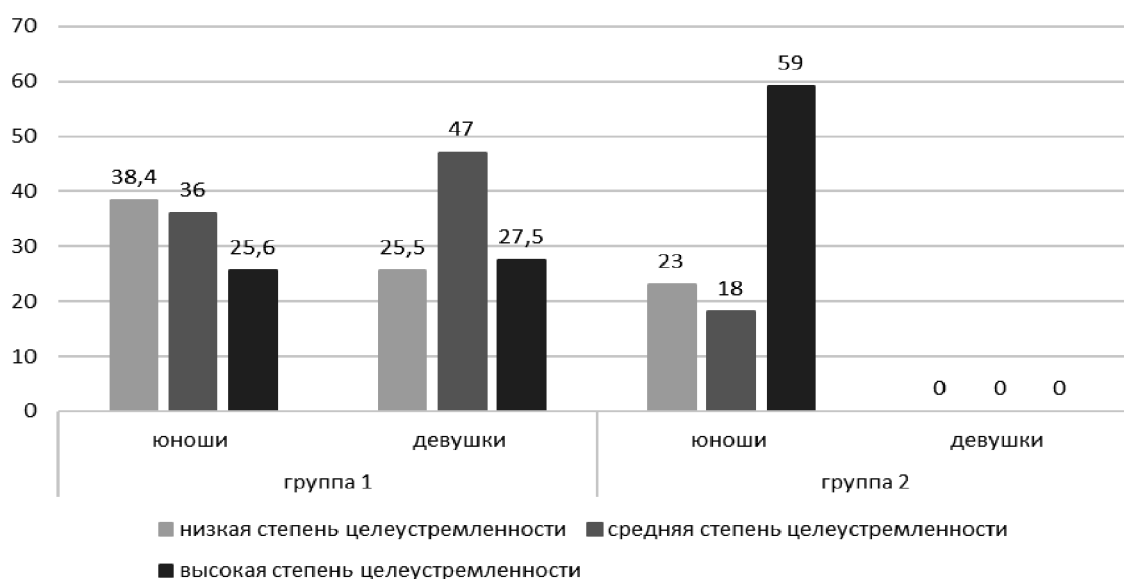
Рис. 1. Дифференцированные группы юношей и девушек по шкале «Цели в жизни», % от выборки

Статистическая проверка взаимосвязи показателей указанных двух критериев проводилась при помощи коэффициента корреляции Пирсона. Дифференцированные результаты по группам юношей и девушек представлены на рис. 1 и 2.