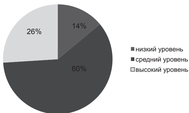
Рис. 2. Этническая толерантность

У 30 чел. (60 %) выявлен средний уровень межэтнической толерантности. 13 респондентов (26 %) обладают высоким уровнем межэтнической толерантности, а 7 чел. (14 %) опрошенных показали низкий уровень межэтнической толерантности (рис. 2).