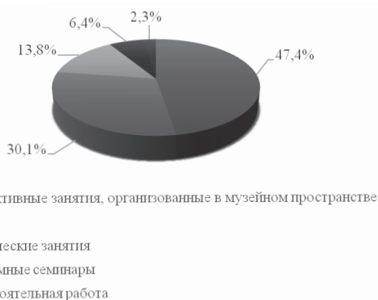
Рис. 2. Результаты ответов на вопрос: «Какие формы организации учебного процесса в системе повышения квалификации наиболее эффективны для Вас?»

Формирование социальной и культурной идентичности личности, обладающей определенными знаниями, умениями, навыками, способностями и готовностью к социокультурной деятельности, лежит в основе формирования культурологической компетентности педагога в системе повышения квалификации. Данная компетентность может быть определена как успешное решение задач и проблем в учебной и практической деятельности преподавания курса «Основы религиозных культур и светской этики» на основе культуроориентированного подхода, реализуемого в различных