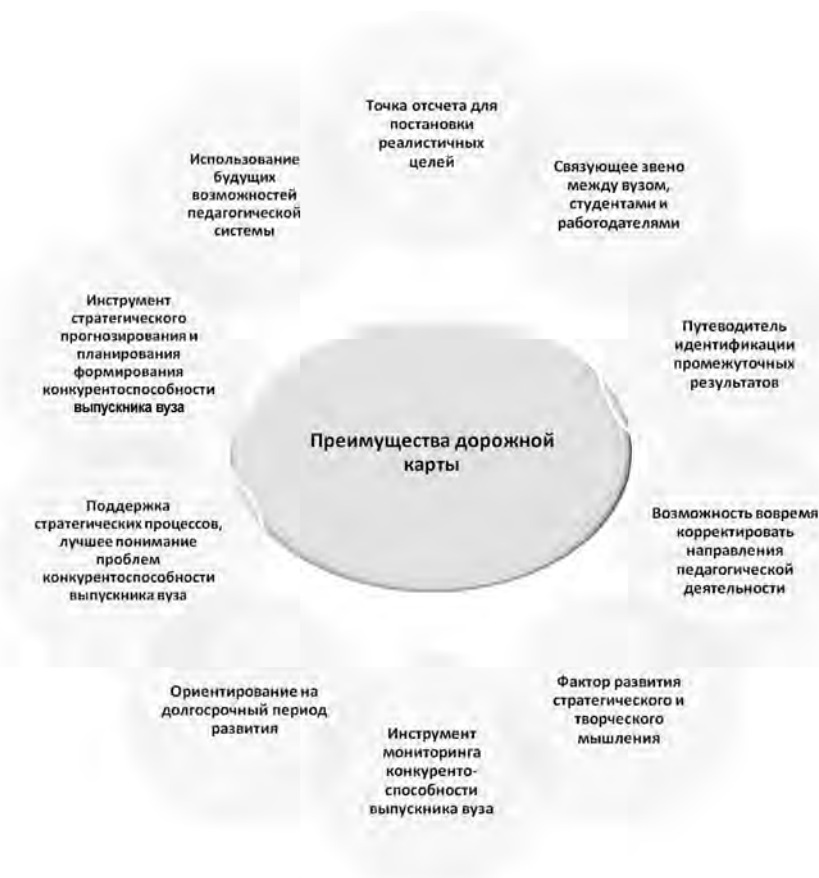
Рис. 2. Преимущества дорожной карты реализации педагогической стратегии формирования конкурентоспособности выпускника вуза

При построении дорожной карты реализации педагогической стратегии формирования конку-