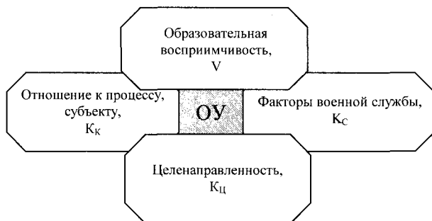
Рис. 2 Модель объекта с учетом его инертности

K_U - коэффициент целерассогласования в системе; K_K - коэффициент конфликтности, основанный на понятии личностного социально-психологического состояния, отображающего отношение объекта к процессу управления, в рассматриваемом случае - к "командиру".