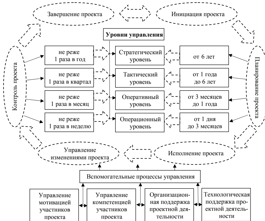
Рис. 1. Модель организации проектно-ориентированного управления в органах государственной власти (составлено автором по данным [2])

В 2014 г. в РФ открыта независимая площадка, в рамках которой взаимодействуют эксперты, развивающие проектное управление [6]. С 2015 г. Аналитический центр при Правительстве РФ проводит ежегодный конкурс «Проектный Олимп», по итогам которого определяются регионы, демонстрирующие лучшие практики в данном направлении. Лидером 2018 г. в номинации, оценивающей сформированную систему управления проектной деятельностью, стала Белгородская область, на втором месте оказалась Республика Крым, а третье место поделили Республика Саха (Якутия) и Свердловская область [2]. В связи с этим опыт данных регионов наиболее интересен для исследования. Так, например, при поддержке Правительства Белгородской области в качестве инструмента технологической поддержки проектной деятельности на базе платформы Motiware Melody One разработана