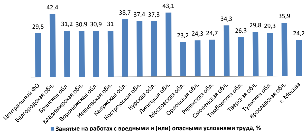
Рис. 2. Доля занятых на работах с вредными и (или) опасными условиями труда работников, осуществляющих деятельность по сельскому хозяйству, охоте и лесному хозяйству, добыче полезных ископаемых, в обрабатывающих производствах, по производству и распределению электроэнергии, газа и воды, в строительстве, на транспорте и в связи по регионам Центрального федерального округа РФ (на конец 2016 г.)

В табл. 2 представлены общие результаты сравнения областей ЦФО (за исключением г. Москвы)