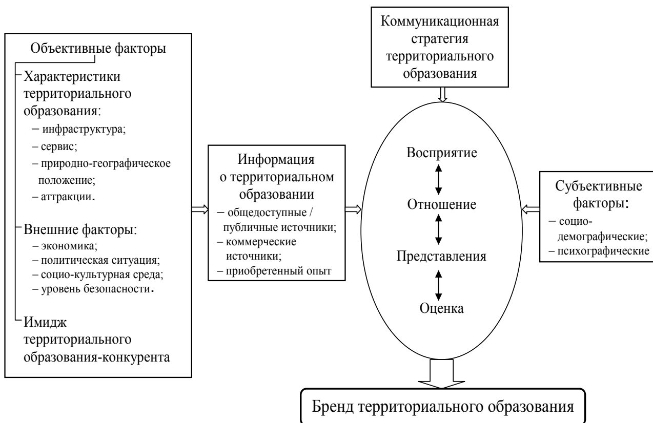
Рис. 2. Процесс формирования бренда территориального образования [составлено на основе теоретического подхода Л. Г. Кирьяновой, 4]

– духовно-историческое измерение (восприятие исторического и религиозного наследия, развитие