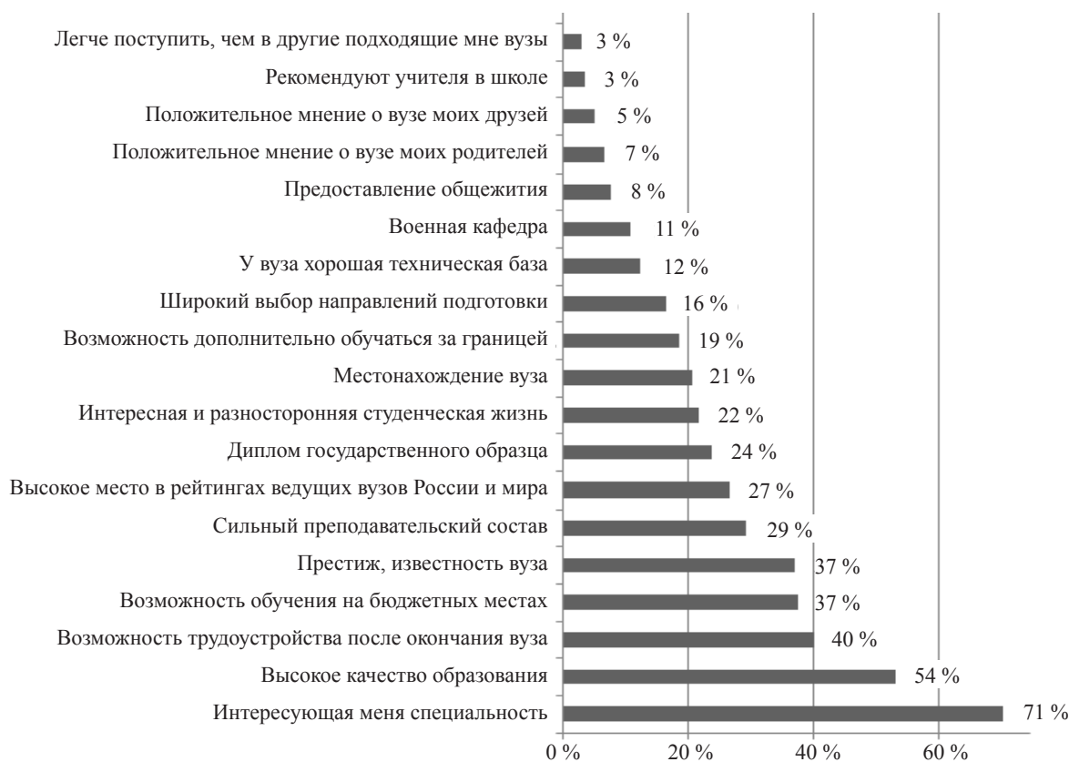
Рис. 2. Причины выбора вуза

открыто высказывается об испытываемых им эмоциях. По мнению ряда исследователей, использование метода семантического дифференциала позволяет выявить глубинные, неосознаваемые характеристики сознания респондентов и получить количественные меры их оценки [9]. Применение данного метода дает возможность выявить семантические особенности, имеющие значение и вызывающие положительные или отрицательные эмоции, у различных аудиторий в отношении исследуемого объекта. Построение семантического пространства представляет собой переход от языка, содержащего больший набор признаков описания, к более простому и емкому языку формализации, содержащему меньшее число категорий факторов и выступающему своеобразным метаязыком по отношению к первому [там же].