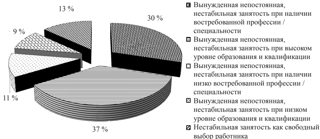
Рис. 3. Оценка нестабильной занятости респондентами, в % к респондентам, охваченным этим видом занятости