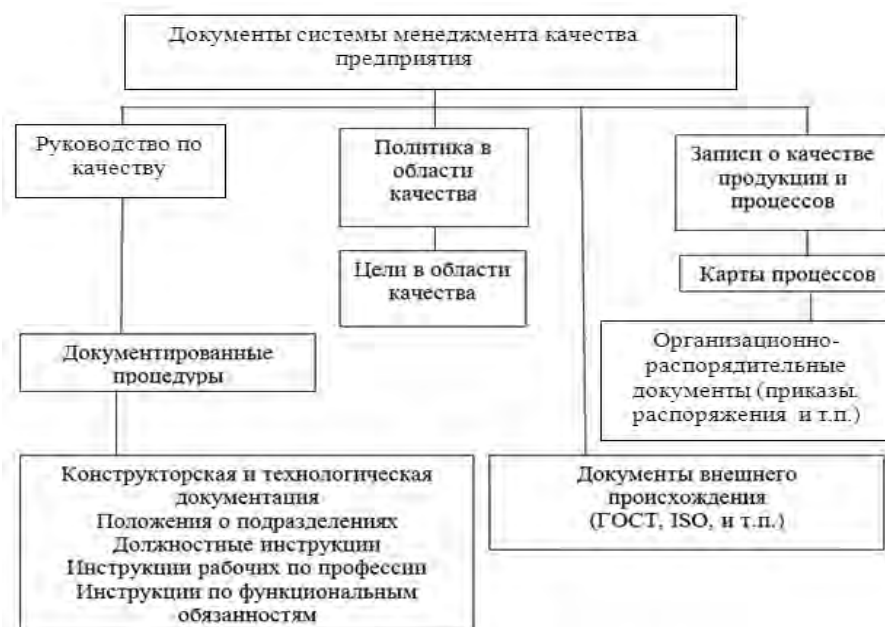
Рис. 1. Структура источников информации, используемой для проведения маркетингового исследования в области СМК предприятий

Как видим из рисунка, одним из важнейших элементов информационной базы маркетингового исследования СМК предприятий выступают карты процессов, что обусловлено современными тенденциями построения систем управления качеством. Сегодня большинство существующих систем менеджмента качества хозяйствующих субъектов создаются и поддерживаются в рабочем состоянии на основе процессно-ориентированного подхода в