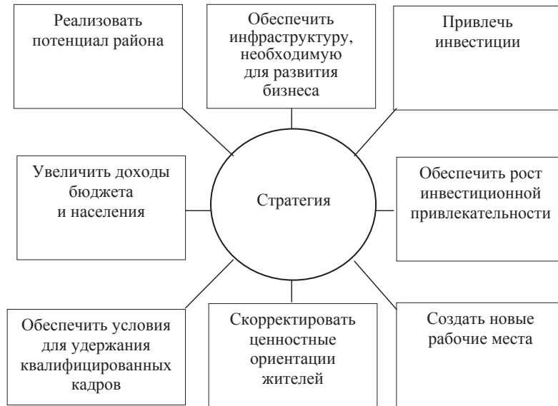
Рис. 1. Стратегические цели

С другой стороны, нами предлагаются инструменты перехода от результатов анализа и построения матрицы решений к стратегическим картам.