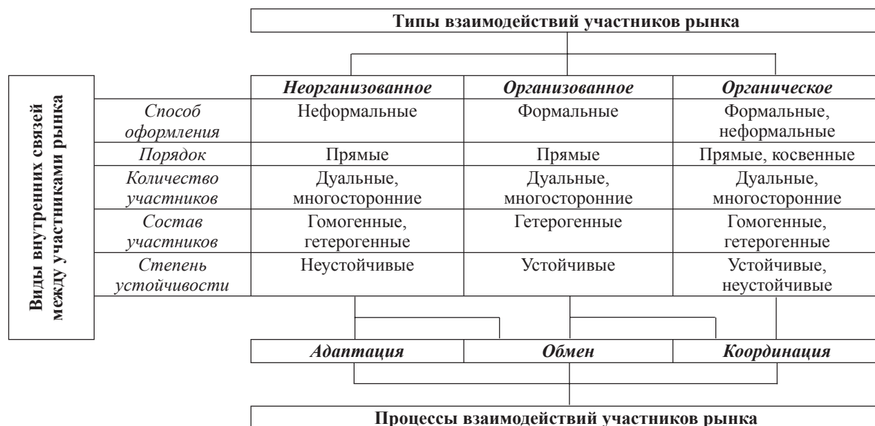
Рисунок. Процессы и соответствующие им типы взаимодействий участников рынка