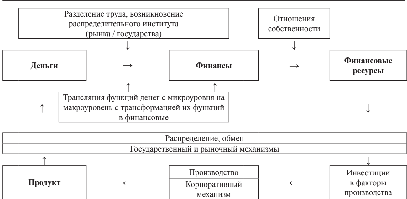
Рис. 1. Схема превращения денег в финансы и финансовые ресурсы

ка) трансформируются в финансы – источники для инвестиций. Далее посредством финансов и благодаря действию отношений собственности субъекты присваивают фонды денежных средств – финансовые ресурсы, которые затем опять же через соответствующие рынки и государство отчуждаются от первоначальных владельцев благодаря действию отношений собственности и направляются на финансирование факторов производства. В результате совершаются инвестиции, превращающие природные, материальные, трудовые и информационные ресурсы в факторы производства. Следовательно, процесс трансформации инвестиций в факторы производства, опосредованный метаморфозой вышеуказанных традиционных ресурсов, является объективной основой для превращения финансов в финансовые ресурсы.