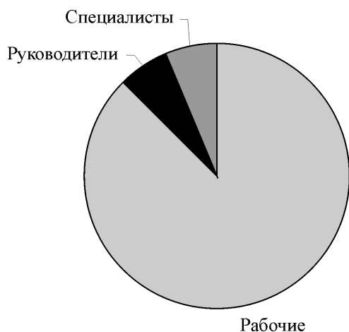
Рис. 1. Структура производственного персонала ООО «СМПЗ»

На предприятии заметна тенденция старения персонала. По вакансиям, на которые раньше требовались кандидаты «до 35 лет», уже сейчас эта цифра увеличена «до 45 лет». Средняя численность производственного персонала на заводе в 2010–2011 гг. составила 475 человек. Его структуру можно представить следующим образом (рис. 1).