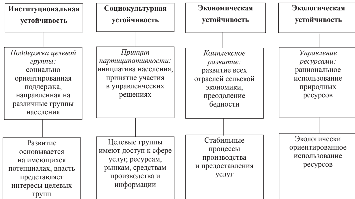
Рис. 2. Составляющие концепции регионального сельского развития