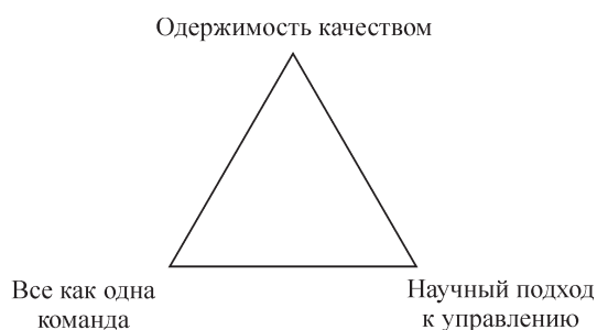
Рис. 1. Треугольник Джойнера

Как видим, универсального подхода к определению концепции TQM не существует, однако данные определения были выбраны нами не случайно. Анализируя первое определение, отметим важность таких составляющих, как вовлечение всех членов организации и «достижение долговременного успеха». Б. Джойнер в свою трактовку добавляет «научный подход к управлению», а В. А. Липидус особо подчеркивает, что концепция TQM полностью охватывает организацию. Таким образом, основываясь на положениях, представленных в данных определениях, можно утверждать что организация, реализующая концепцию TQM, должна быть направлена на создание системы управления, целью которой является достижение долгосрочного преимущества за счет качества и вовлечения сотрудников всех уровней организации. Как следствие возникает необходимость определения ключевых элементов концепции, в совокупности способствующих созданию такой системы управления. Общую схему основных элементов концепции TQM можно представить в виде рис. 2.