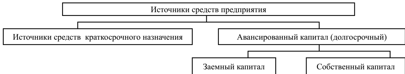
Рис. 2. Структура источников средств организации

Наряду с отличиями между заемным и собственным капиталом имеются и некоторые сходные