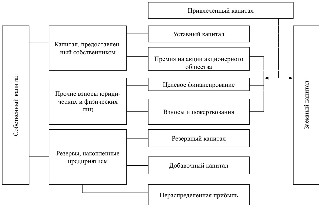
Рис. 4. Структура привлеченного капитала

дитных отношений. В свою очередь конвертируемые облигации можно рассматривать как увеличение собственного капитала. Но, принимая во внимание тот факт, что особенности перечисленных ценных бумаг вызваны желанием руководства акционерного общества сделать более привлекательным для различных инвесторов вложение средств и то, что право, предоставляемое различными акциями и облигациями, может быть не реализовано их владельцами, например, владелец конвертируемой облигации может не воспользоваться правом обменять облигацию на обычную акцию, то ограничимся пониманием того, что привлечение капитала в виде выпуска акций является собственным капиталом, а облигационные займы – заемным капиталом.