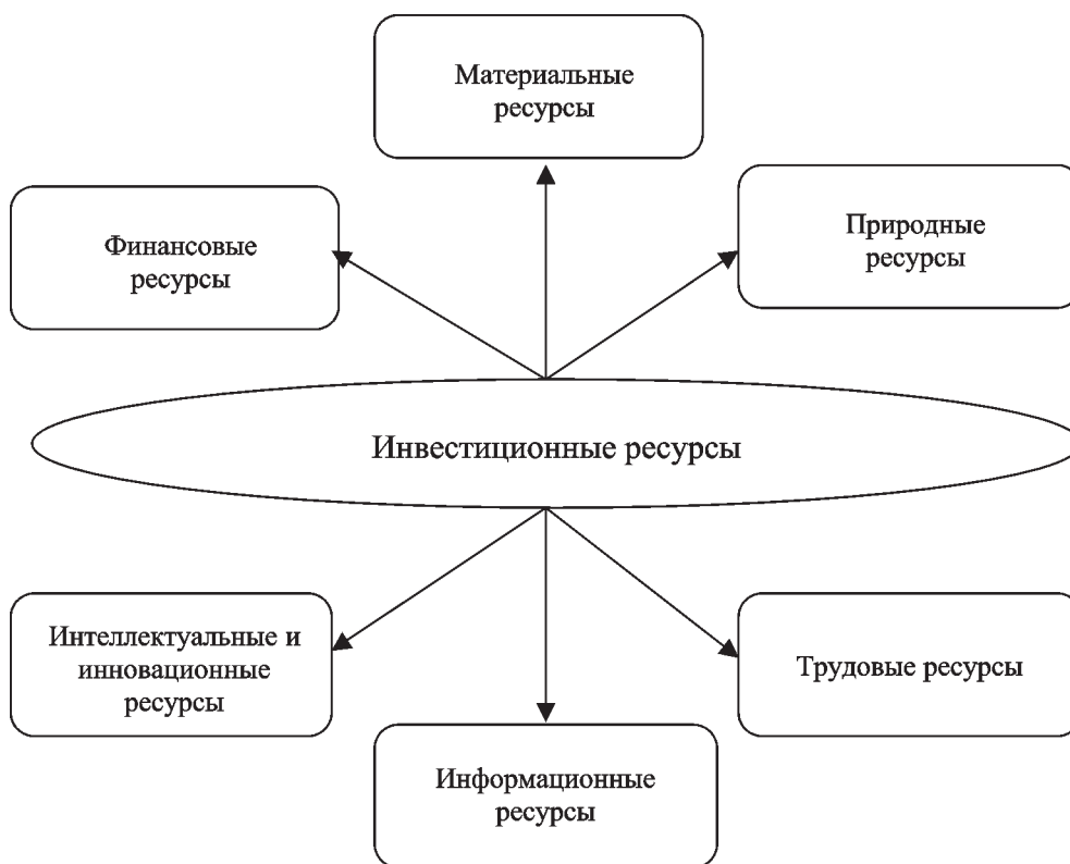
Рис. 2. Классификация инвестиционных ресурсов

Указанная специфика инвестиционных товаров, их качественная неоднородность так же, как и качественная неоднородность самих инвестиций, имеющих различные формы существования, делает невозможным физическое присутствие на рынках инвестиционного капитала (инвестиционных ре-