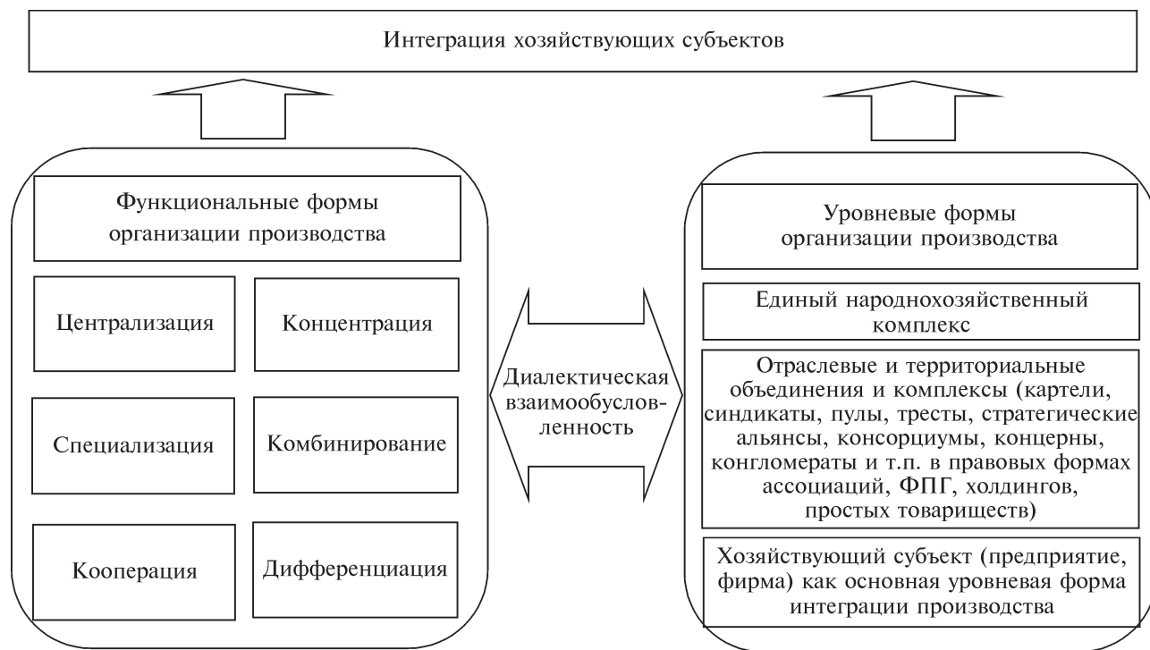
Рис. 1. Интеграция хозяйствующих субъектов как синтезирующая закономерность

В экономической литературе выделяют два вида циклов: цикл количественно-каче-