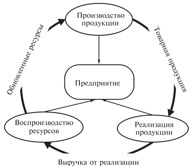
Рис. 1. Предприятие как единство трех основных хозяйственных процессов

Таким образом, взгляд на предприятие как принципиально анизотропную систему сменяется здесь ее более или менее изотропным рассмотрением, в каком-то смысле близким к средовому подходу.